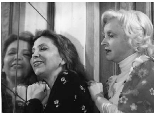
Femmes Femmes © Alain Venisse

Ecrivain, cinéaste, acteur né en 1930, Paul Vecchiali a réalisé 25 longs-métrages pour le cinéma ( Corps à Cœur , Rosa la Rose , Once More , Femmes femmes , À vot' bon cœur... ) ainsi que de nombreux téléfilms. Ancien critique aux Cahiers du cinéma et à Image et Son , acteur, producteur - il monte "Diagonale", sa maison de production, en 1976 -, il est l'auteur de douze romans, dont Les Frontières de l'aube (Stock, 1999), La Pieuvre par neuf (« Le Poulpe », 2000) et Indécente mémoire (H&O, 2012). Son dernier film, Nuits blanches sur la jetée sort le 28 janvier 2015.