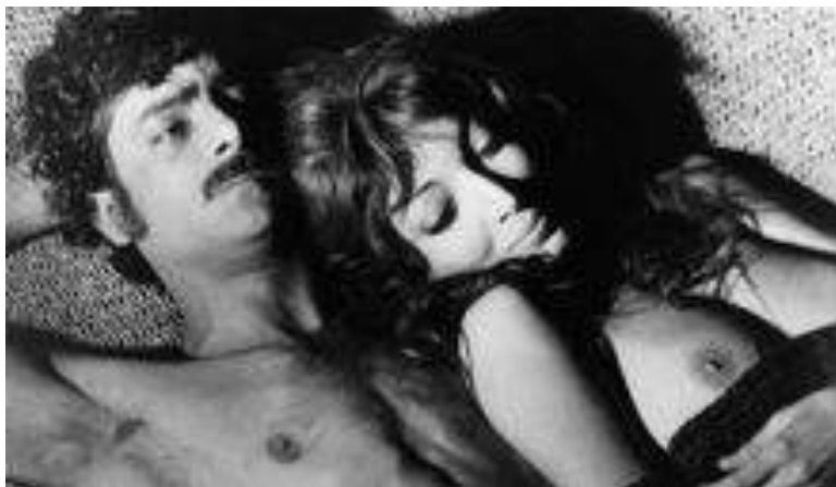
Film d'amour et d'anarchie

Lina Wertmüller est née en 1926 en Allemagne. Elle fait ses débuts dans le théâtre de marionnettes puis fonde à 24 ans sa propre troupe d'avant-garde. Elle rencontre Federico Fellini en 1962 et travaille avec lui en tant qu'assistante sur Huit et demi avant de réaliser ses films. La cinéaste a très rapidement affirmé sa singularité à travers une série de films portant sur la condition de la femme ( Cette fois-ci, parlons des hommes , 1965) où elle se présente clairement comme une cinéaste engagée et féministe.