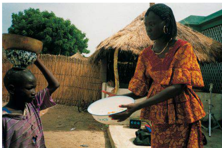
Mossane