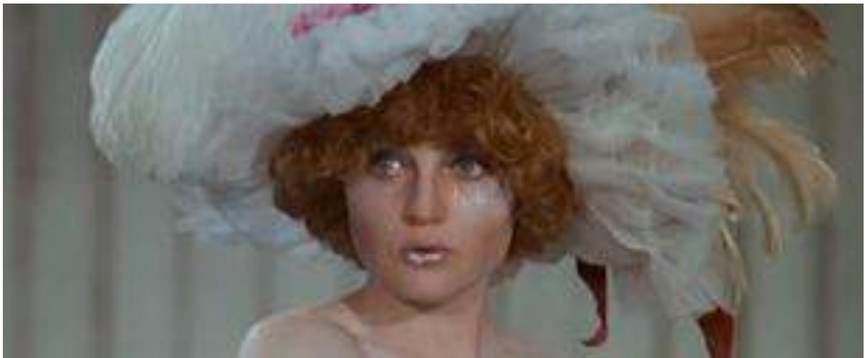
Valérie Mairesse dans L'Une chante, l'autre pas (1977) d'Agnès Varda.

Après avoir débuté comme photographe de théâtre, Agnès Varda réalise son premier long métrage de fiction, La Pointe courte, en 1954, avec Philippe Noiret. Le film s'impose aussitôt comme l'une des références de la jeune génération française, dont les goûts et les caractéristiques conflueront bientôt dans celle qui sera définie comme la Nouvelle Vague. Variant les techniques et les styles, de la fiction au documentaire, Agnès Varda s'est imposée comme l'une des figures majeures du cinéma français et international. Elle a très tôt orienté son cinéma vers la condition de la femme ; on peut notamment penser à Réponses de femmes ou encore à L'Une chante, l'autre pas, qui suit deux femmes libres et révoltées qui croisent, au point de confluence de leurs histoires, la véritable Gisèle Halimi au moment du procès de Bobigny.